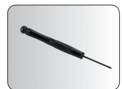
Schraubenzieher im Lieferumfang