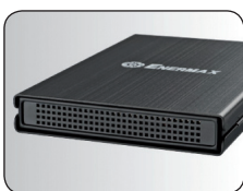
Belüftungsöffnungen in der Front