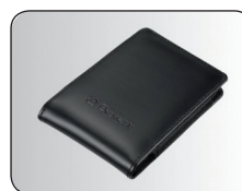
Hochwertiges Etui in Lederoptik