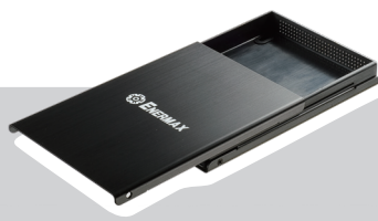
Schraube lösen, Gehäusedeckel aufschieben